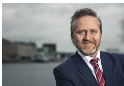
Anders Samuelsen Udenrigsminister