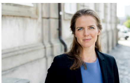
Ellen Trane Nørby Sundhedsminister

Når danske sundheds- og life science virksomheder udvikler produkter og løsninger af høj faglig kvalitet, sker det ofte i tæt samarbejde med det offentlige sundhedsvæsen. Det forbilledlige samarbejde mellem private og offentlige sundhedsaktører kan vi med fordel lade os inspirere af i internationaliseringsindsatsen. Her når vi også længst, når virksomhederne og de offentlige myndigheder arbejder tæt sammen. Denne strategi skal bidrage til at understøtte samarbejdet yderligere.